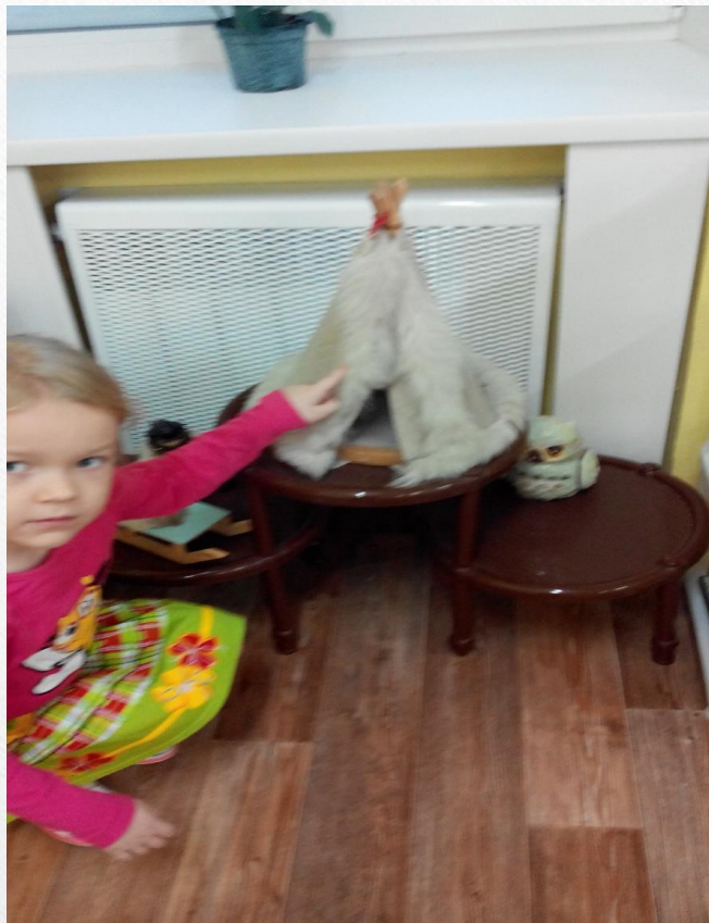
Мини музей детского сада