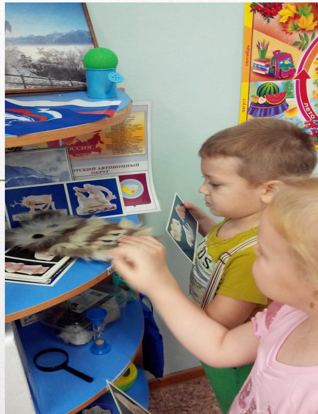
Мини музей группы № 4