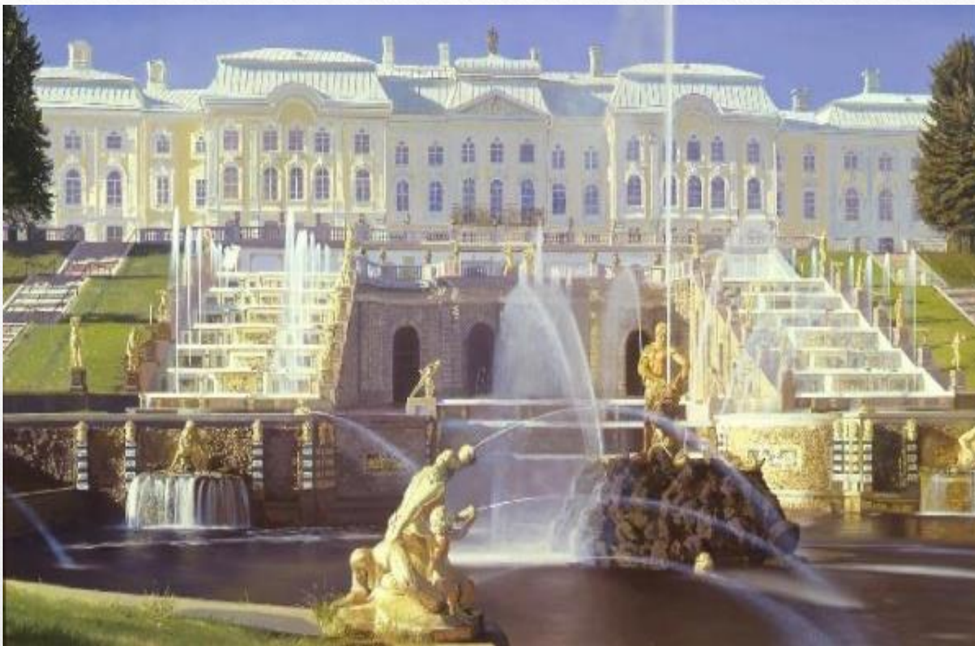
Музей заповедник «Петергоф»