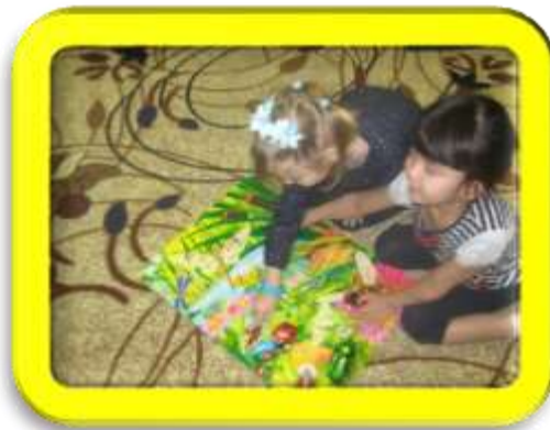
Мои любимые сказки