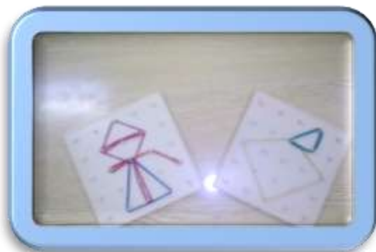
Продуктивная игра «Расскажи сказку»