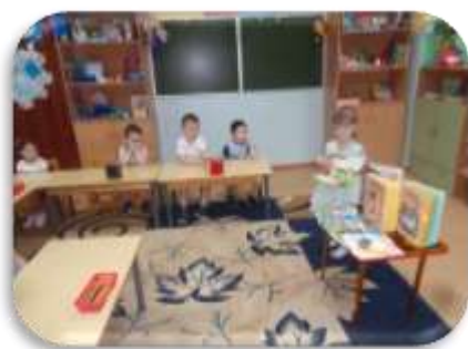
«Мой любимый герой»

Цель: учить оценивать поступки героев, прививать любовь к художественному слову, развивать интерес к книге с дошкольного возраста, развивать все компоненты устной речи, творческие способности, пополнять словарный запас детей, улучшение всех сторон развития речи, памяти, улучшение партнерского взаимоотношения детей и детей.