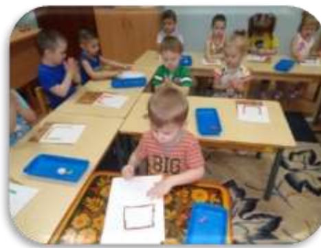
«Дом в котором мы живем»