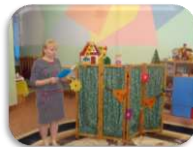
«Кот петух и лиса»