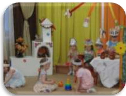
«Волк и семеро козлят»