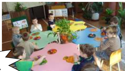
Мастерская « Умельцы»