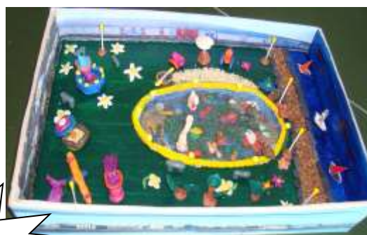
Макет «Озеро Надежды»