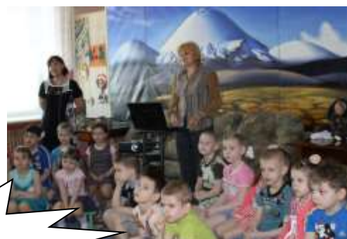
Клуб «Экологи Певека» Развивающие игры.