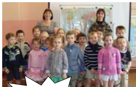
Встреча с гидрологом

2. Методистом отдела экологического просвещения «Заповедник о. Врангеля» и ребятами из экологического клуба МОУ «Центр образования» «Экологи Певека» - дети с интересом слушали и посмотрели презентацию, рассказывающую об острове Врангель и его обитателях. Узнали, что зимой озера и реки на острове промерзают до дна, поэтому рыбы в них нет, лишь иногда из моря заходят гольцы (№1).